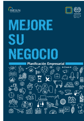
MESUN de Planificación empresarial