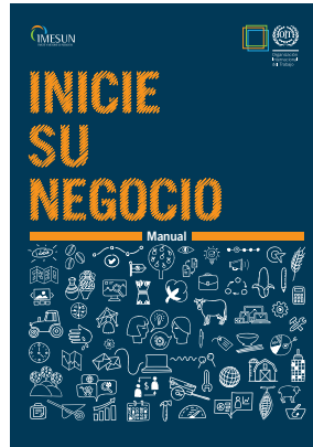
Manual ISUN + Cartilla de Plan de Negocios